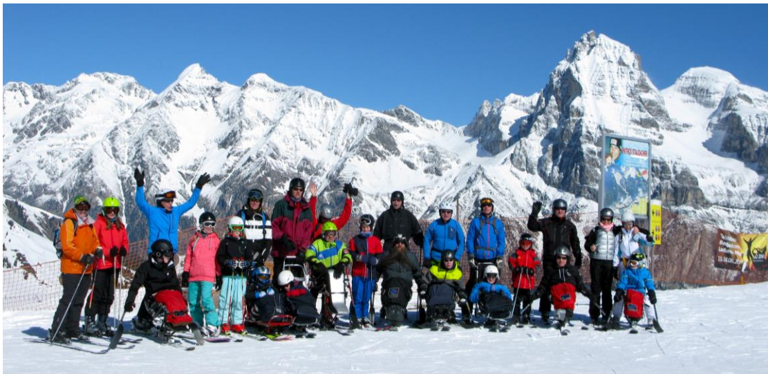
TN S&C 2014