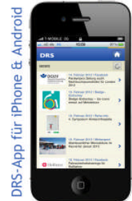
DRS-App für iPhone & Android