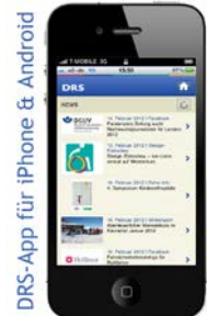
DRS-App für iPhone & Android