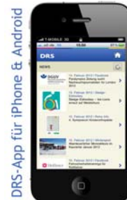
DRS-App für iPhone & Android