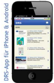
DRS-App für iPhone & Android